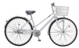
42 27SR-SZ-HD (スノーホワイト: W08)