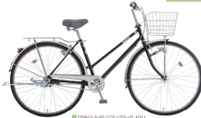
27SRV-S-5-HD (ピアノブラック: K01)