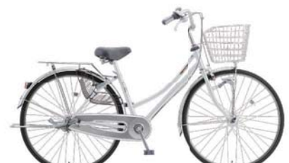
27LWT-S-3-HD (スノーホワイト: W08)