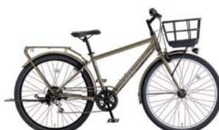
3 27.5XAO-K-6-HD (フラットカーキ: C80)