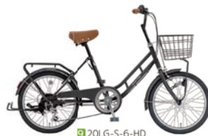
9 20LG-S-6-HD (フラットブラック: K02)