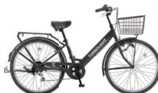
2 26VZ-K-6-HD (フラットブラック: K02)