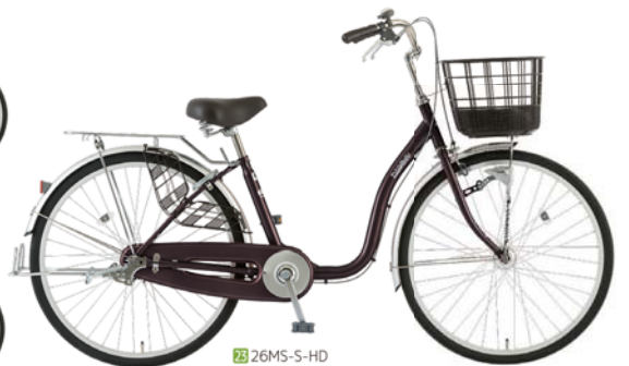
23 26MS-S-HD (アンバーブラウン:C11)