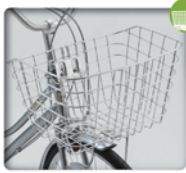
大型カク型ワイヤーステンカゴ