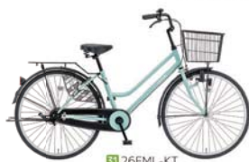
31 26FML-KT (MSミント: G22)