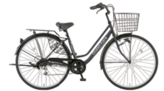
12 27TW-K-6-HD (フラットブラック: K02)