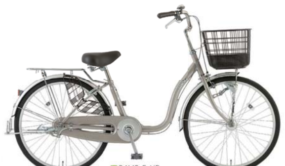
25 24MS-S-HD (アッシュゴールド:C96)