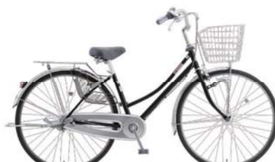
27LWT-S-3-HD (ピアノブラック: K01)