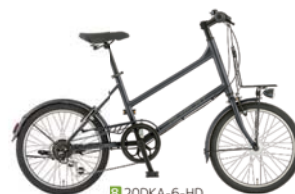
8 20DKA-6-HD (フラットブラック: K02)