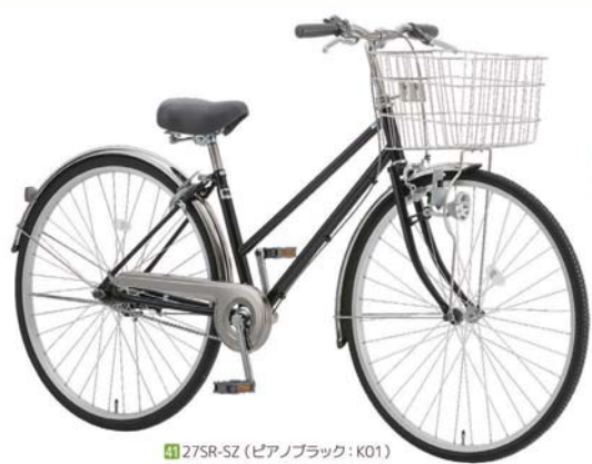
41 27SR-SZ (ピアノブラック: K01)