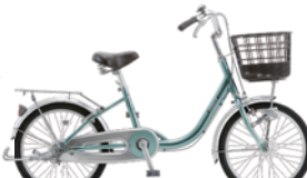
22 20MLA-S-HD (フレッシュミント:G20)