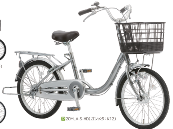
22 20MLA-S-HD (ガンメタ:K12)