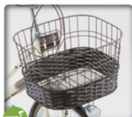
藤カゴ風とワイヤーを組み合わせた構円カゴ

ステンレスパーツ ●ハンドル ●バスケットブラケット ●ドロヨケステー ●バスケット足