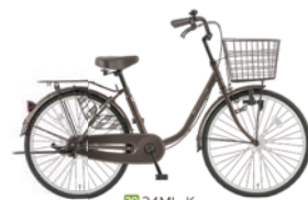
29 24ML-K (アンバーブラウン: C11)