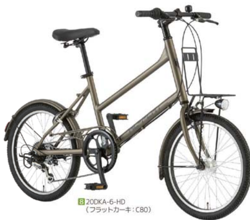
8 20DKA-6-HD (フラットカーキ: C80)