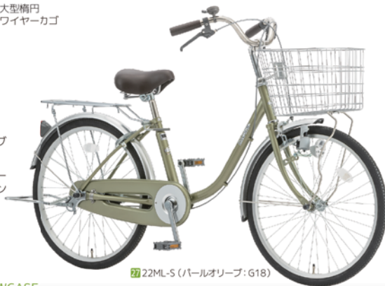
27 22ML-S (パールオリーブ: G18)