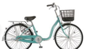
25 24MS-S-HD (フレッシュミント:G20)