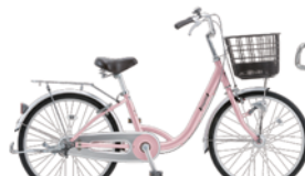
21 22MLA-S-HD (MSローズ:P22)