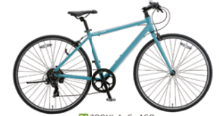
54 700XLA-6 460 (NJブルー：B17)