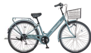
1 27.5VZ-K-6-HD (Mグレー: S53)