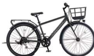
3 27.5XAO-K-6-HD (フラットブラック: K02)