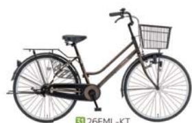
31 26FML-KT (アンバーブラウン: C11)