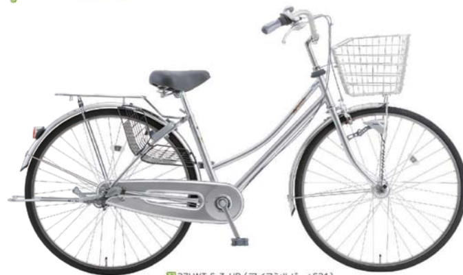
27LWT-S-3-HD (アイスシルバー: S21)