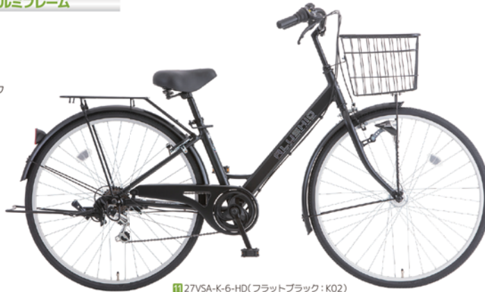
11 27VSA-K-6-HD (フラットブラック: K02)