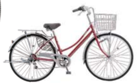
52 26LW-SZ-6-HD (プラムレッド: R13)