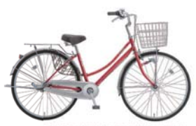
47 27LWH-SZ-3-HD (サーモンピンク: P42)