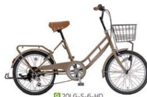
9 20LG-S-6-HD (フラットベージュ: C95)