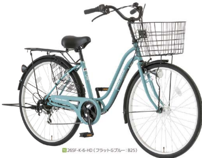
16 26SF-K-6-HD (フラットGブルー:B25)