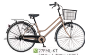
30 27FML-KT (フラットカフェ: C06)