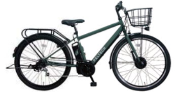
5 TDA-207ZP (マットカーキ)