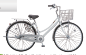
47 27LWH-SZ-3-HD (スノーホワイト: W08)