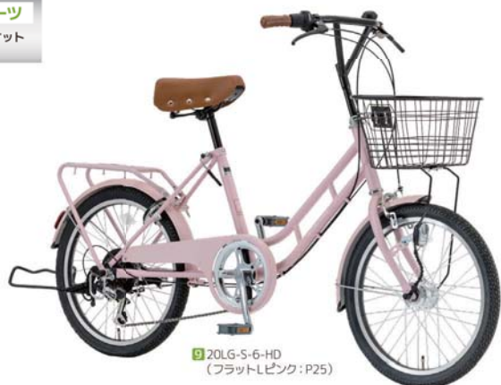
9 20LG-S-6-HD (フラットピンク: P25)