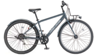
4 27.5XAO-K-6-HD-CR (フラットグレー: S95)