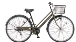
13 27PX-K-6-HD (フラットカーキ: C80)