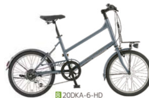
8 20DKA-6-HD (フラットLグレー: S09)