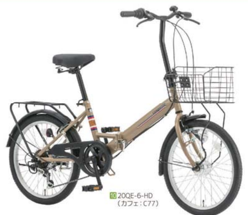
10 20QE-6-HD (カフェ: C77)