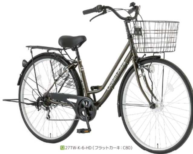
12 27TW-K-6-HD (フラットカーキ: C80)