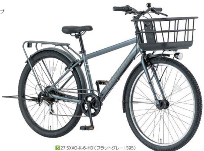
3 27.5XAO-K-6-HD (フラットグレー: S95)