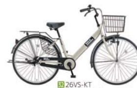
32 26VS-KT (Fホワイトグレー: W14)