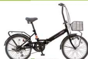
10 20QE-6-HD (ピアノブラック: K01)