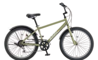
6 24.5XDA-6 (フラットオリーブ: G47)