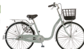
23 26MS-S-HD (フラットLグレー:S05)