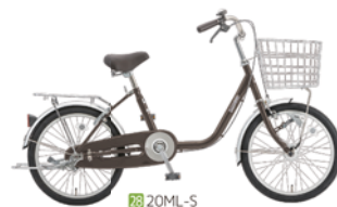
28 20ML-S (アンバーブラウン: C11)