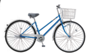
42 27SR-SZ-HD (CLブルー: B97)