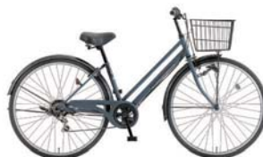
13 27PX-K-6-HD (フラットグレー: S95)