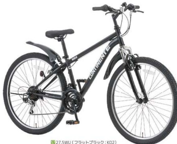
57 27.5WU (フラットブラック：K02)