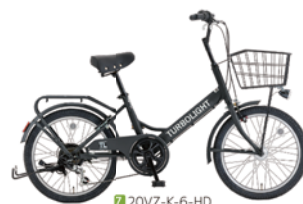
7 20VZ-K-6-HD (フラットブラック: K02)