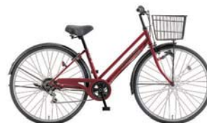
13 27PX-K-6-HD (カーディナルレッド: R81)