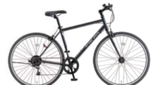
55 700XG-6-HD 490 (フラットブラック：K02)