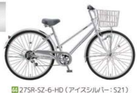
41 27SR-SZ-6-HD (アイスシルバー: S21)