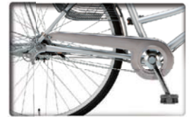
内装5段用チェーンケース