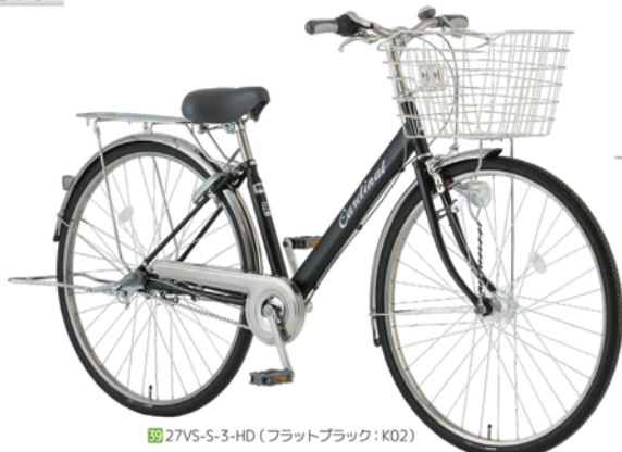
39 27VS-S-3-HD (フラットブラック: K02)