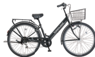
1 27.5VZ-K-6-HD (フラットブラック: K02)