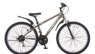
57 27.5WU (フラットカーキ：C80)