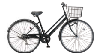
13 27PX-K-6-HD (フラットブラック: K02)