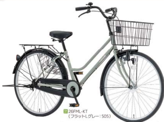
31 26FML-KT (フラットLグレー: S05)