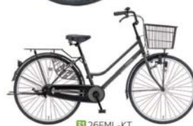
31 26FML-KT (フラットブラック: K02)