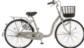
23 26MS-S-HD (アッシュゴールド:C96)