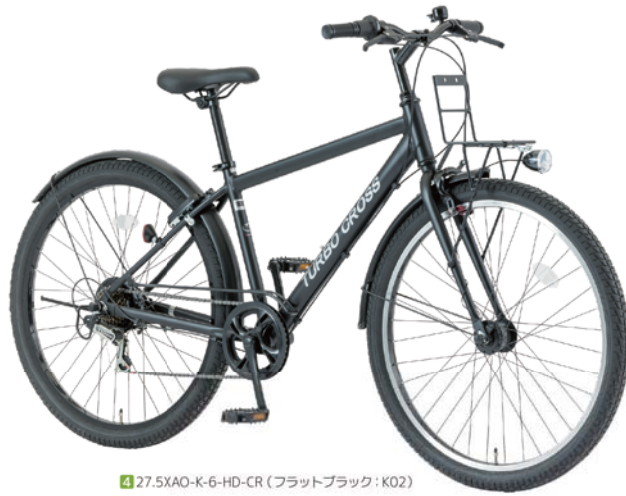
4 27.5XAO-K-6-HD-CR (フラットブラック: K02)