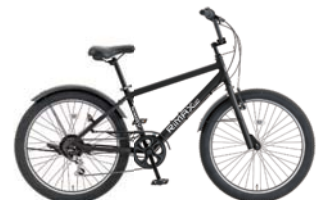
6 24.5XDA-6 (フラットブラック: K02)