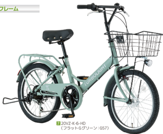
7 20VZ-K-6-HD (フラットGグリーン: G57)