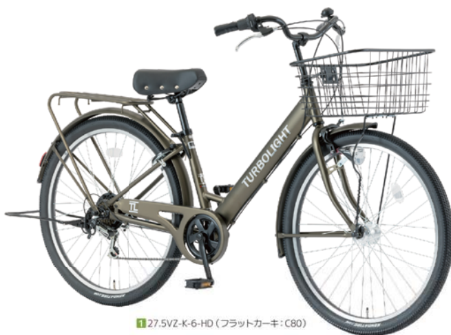
1 27.5VZ-K-6-HD (フラットカーキ: C80)