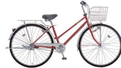
27SRT-S-3-HD (ピュアレッド: R01)