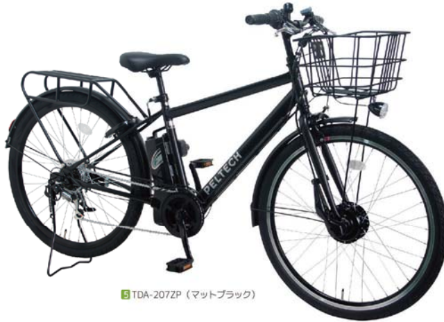
5 TDA-207ZP (マットブラック)