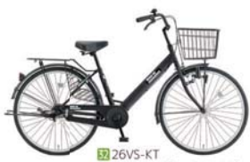
32 26VS-KT (フラットブラック: K02)