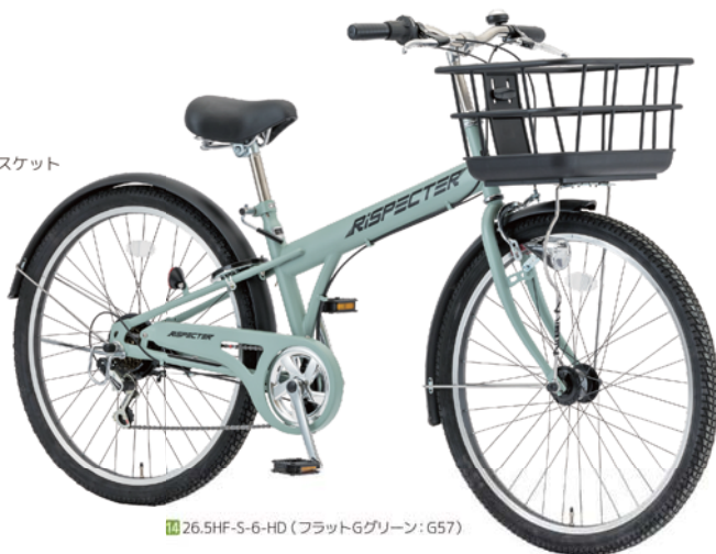
14 26.5HF-S-6-HD (フラットGグリーン:G57)