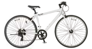
54 700XLA-6-HD 460 (スノーホワイト：W08)