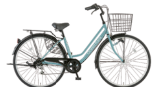
12 27TW-K-6-HD (フラットGブルー: B25)