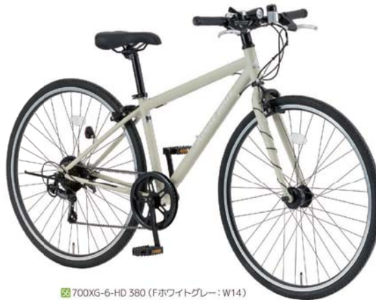
56 700XG-6-HD 380 (Fホワイトグレー：W14)