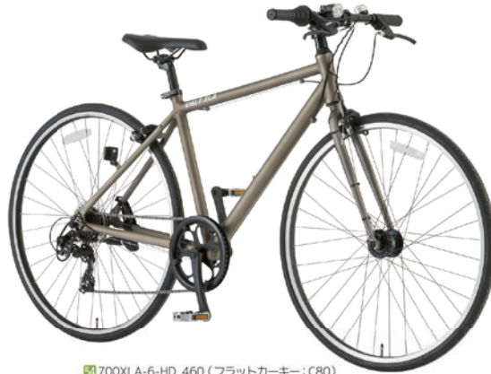
54 700XLA-6-HD 460 (フラットカーキ：C80)