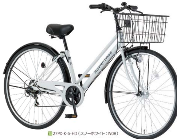
13 27PX-K-6-HD (スノーホワイト: W08)