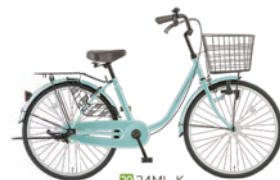
29 24ML-K (MSミント: G22)