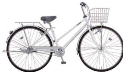
27SRT-S-3-HD (アイスシルバー: S21)