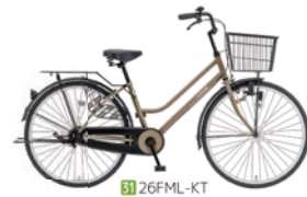
31 26FML-KT (カフェ: C77)