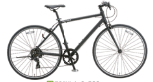
53 700XLA-6 500 (フラットブラック：K02)