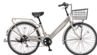
2 26VZ-K-6-HD (グレージュ: S14)