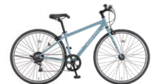
56 700XG-6-HD 380 (ブルーグレー：B91)