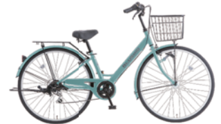
11 27VSA-K-6-HD (Gブルー: B25)