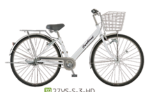
39 27VS-S-3-HD (スノーホワイト: W08)