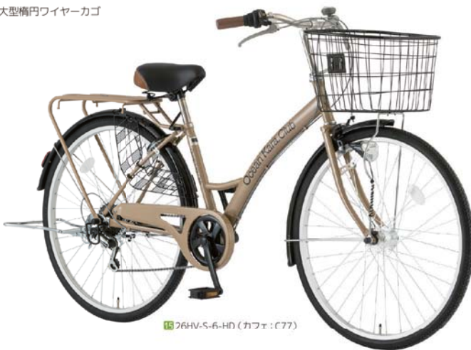
15 26HV-S-6-HD (カフェ:C77)