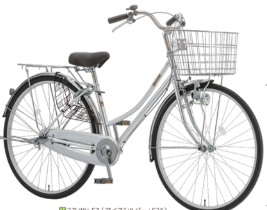
45 27LWH-SZ (アイスシルバー: S21)