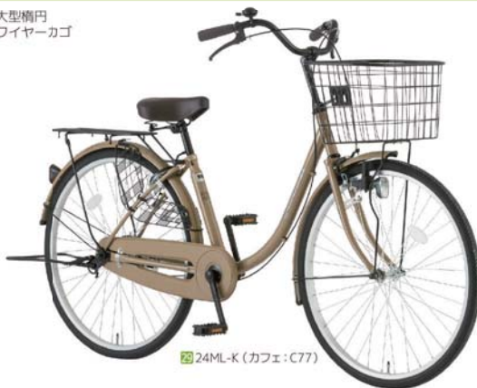
29 24ML-K (カフェ: C77)