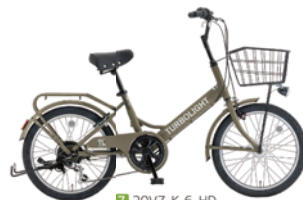
7 20VZ-K-6-HD (フラットカーキ: C80)