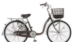
25 24MS-S-HD (アンバーブラウン:C11)