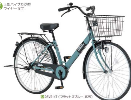
32 26VS-KT (フラットGブルー: B25)