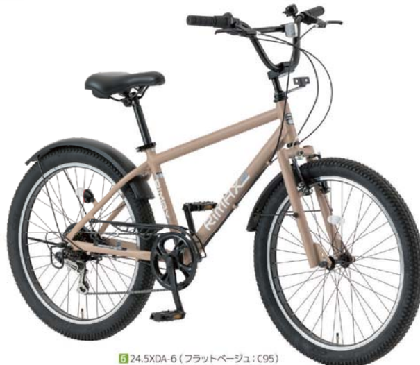
6 24.5XDA-6 (フラットベージュ: C95)