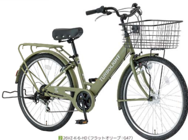
2 26VZ-K-6-HD (フラットオリーブ: G47)