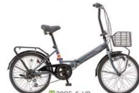
10 20QE-6-HD (フラットグレー: S95)