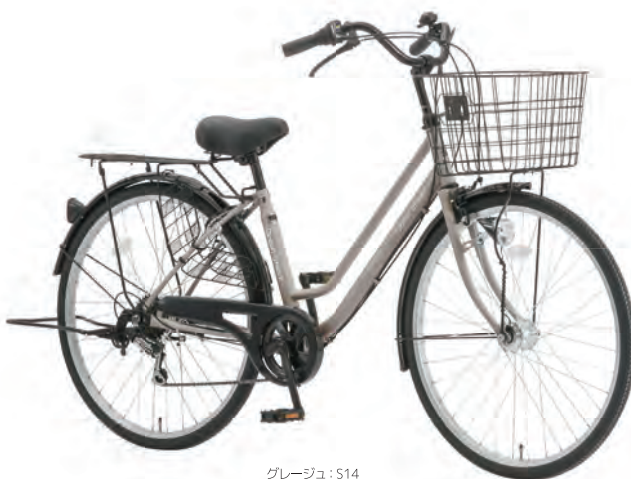
グレージュ : S14