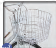
大型楕円ワイヤーカゴ