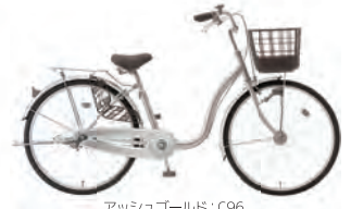
アッシュゴールド : C96