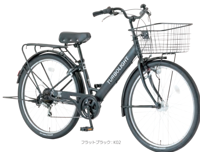
フラットブラック: K02