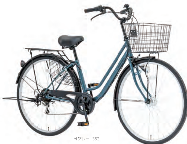
Mグレー : S53