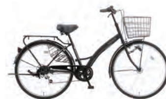
フラットブラック : K02