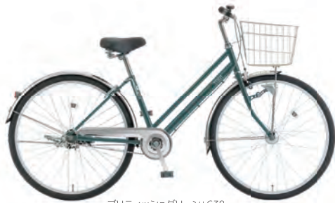
プリティッシュグリーン: G38