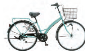
サワーグリーン : G12