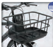
OGK製 FB-069K 樹脂大型軽量中空パイプ バスケット