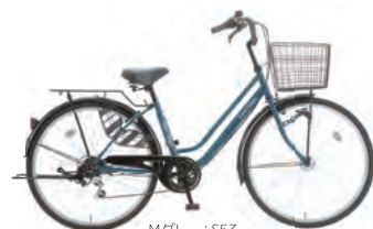
Mグレー : S53