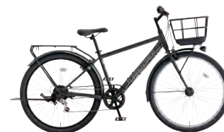
フラットブラック: K02