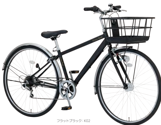
フラットブラック: K02