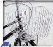
大型カケ型 ワイヤーステンカゴ