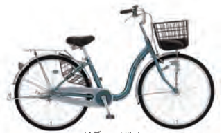
Mグレー : S53