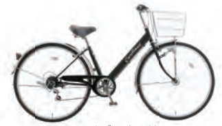
フラットブラック：K02