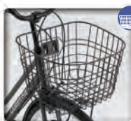
大型楕円 ワイヤーカゴ