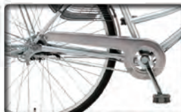
内装5段用チェーンケース