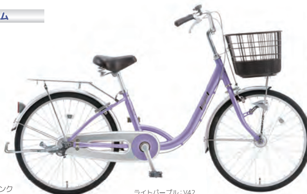
ライトパープル : V42