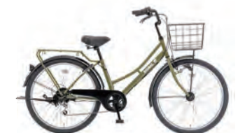
フラットオリーブ:G47