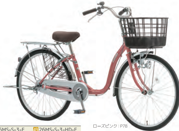
ローズピンク : P78