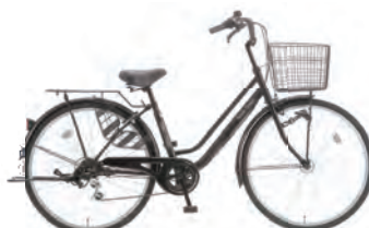
フラットブラック : K02