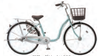
サワーグリーン : G12