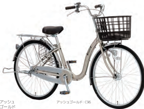
アッシュゴールド : C96