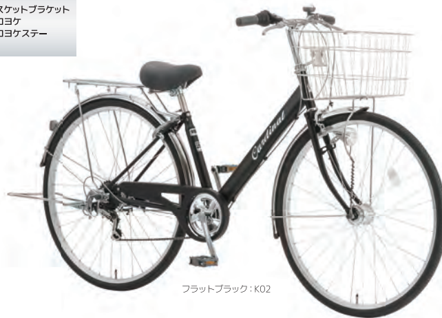
フラットブラック：K02