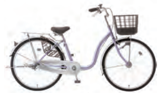
ライトパープル : V42