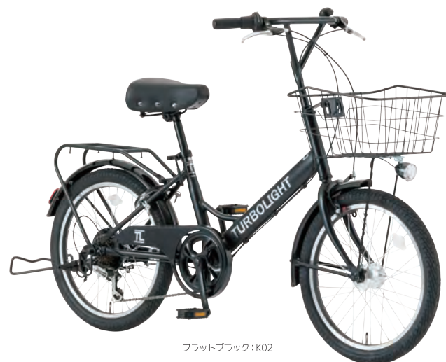
フラットブラック: K02