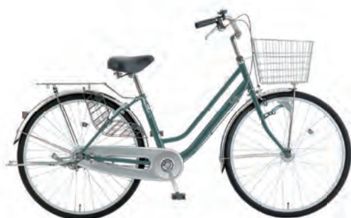
プリティッシュグリーン: G38