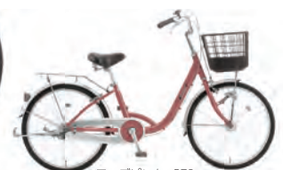
ローズピンク : P78