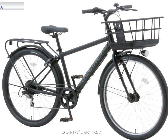
フラットブラック: K02