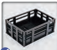
OGK製 SPB-001 コンテナバスケット