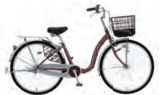
ワインレッド : R04