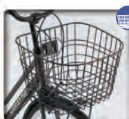
大型楕円 ワイヤーカゴ