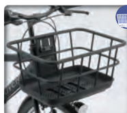
OGK製 FB-069K 樹脂大型軽量中空パイプ バスケット