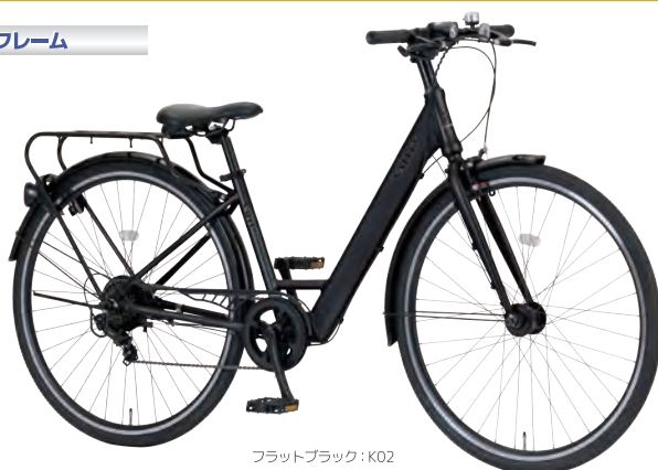
フラットブラック: K02