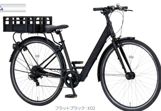
フラットブラック: K02