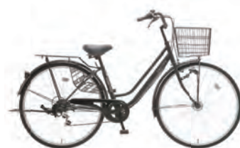
フラットブラック : K02