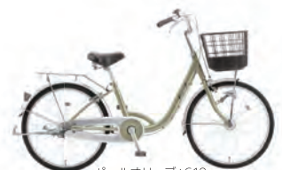
パールオリーブ : G18