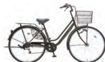
BFカーキ : C10