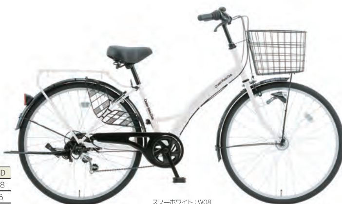
スノーホワイト : W08