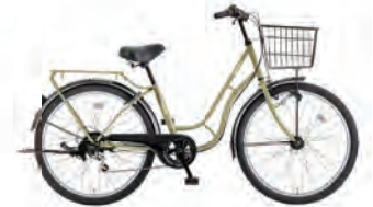
フラットオリーブ:G47