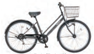
フラットブラック:K02