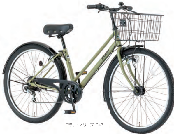
フラットオリーブ:G47