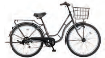
フラットブラック:K02