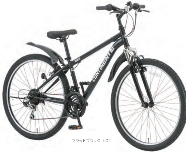
フラットブラック: K02