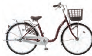
ワインレッド : R04