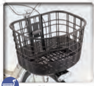
OGK製 FB-037K 樹脂カゴ