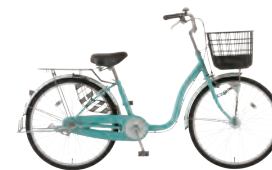
フレッシュミント: G20