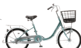
フレッシュミント: G20