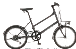
フラットブラック: K02