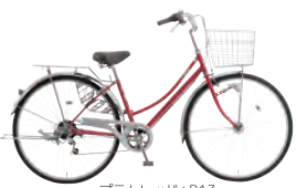
プラムレッド: R13 *47 26LW-SZのみ