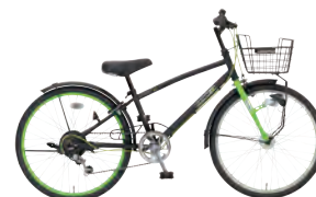
Fブラック/グリーン:G00