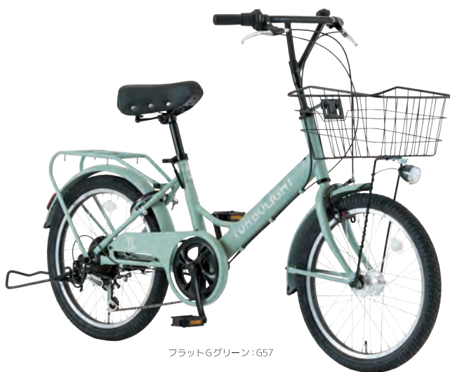
フラットGグリーン: G57