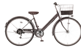
フラットMブラウン:C15