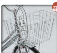
大型カク型 ワイヤーステンカゴ