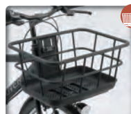
OGK製 FB-069K 樹脂大型軽量 中空パイプバスケット

ステンレスパーツ ●ハンドルバー ●シートポスト ●バスケットブラケット ●バスケット足 ●ドロヨケステー