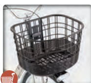
OGK製 FB-037K 樹脂カゴ