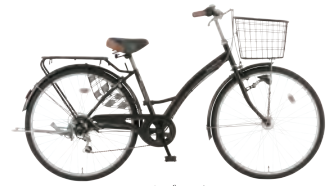
フラットブラック：K02