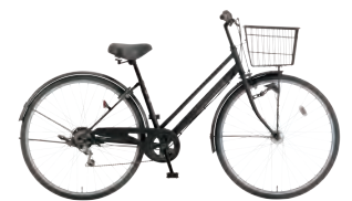
フラットブラック: K02