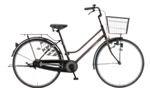
アンバーブラウン: C11 *30 26FML-KTのみ