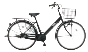
フラットブラック: K02