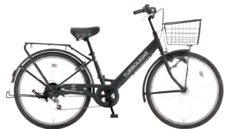
フラットブラック: K02