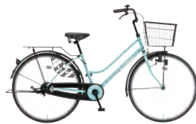
MSミント: G22 *30 26FML-KTのみ