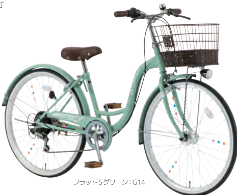
フラットSグリーン:G14