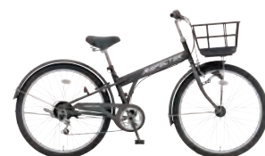
フラットブラック:K02