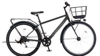
フラットブラック: K02