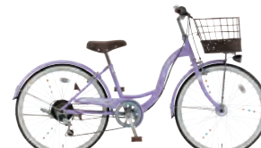
フラットLラベンダー:L14