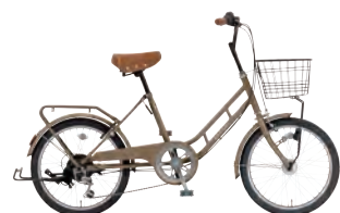
フラットベージュ: C95