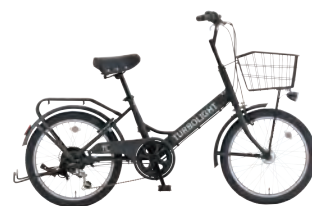
フラットブラック: K02