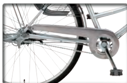
内装5段用チェーンケース