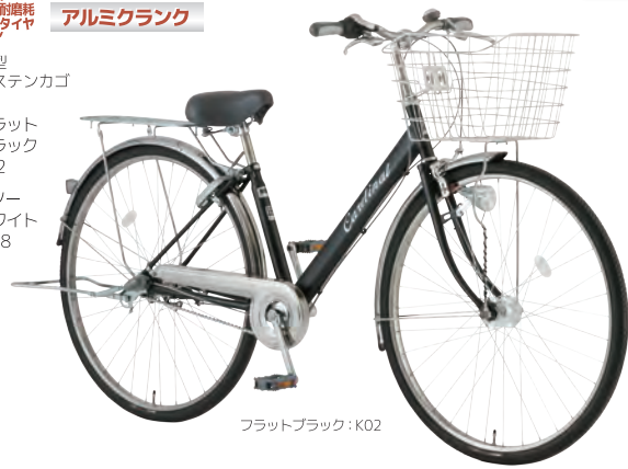
フラットブラック: K02