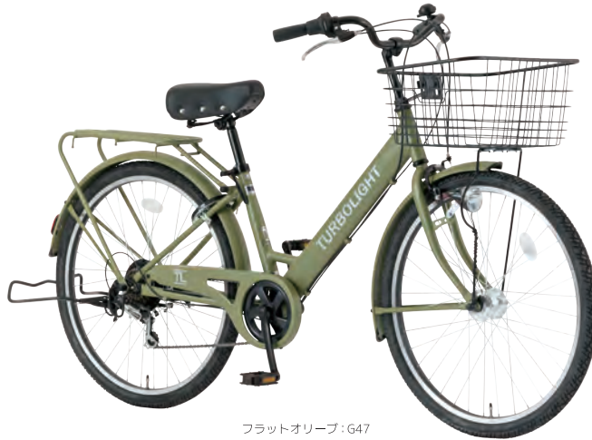
フラットオリーブ: G47