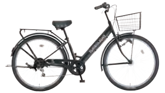
フラットブラック: K02