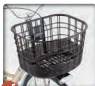
OGK製 FB-037K 樹脂カゴ