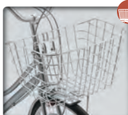
大型カク型 ワイヤーステンカゴ