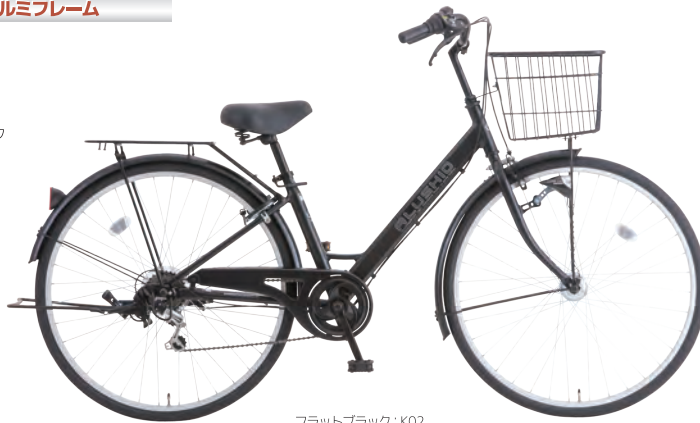
フラットブラック: K02