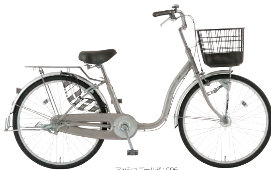
アッシュゴールド: C96