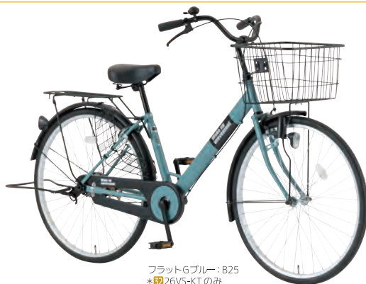
フラットGブルー: B25 *32 26VS-KTのみ