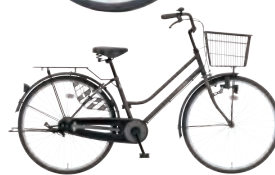
フラットブラック: K02