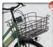
大型ワイヤーバスケット