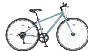
ブルーグレー: B91 *53 700XG-6-HD 380のみ