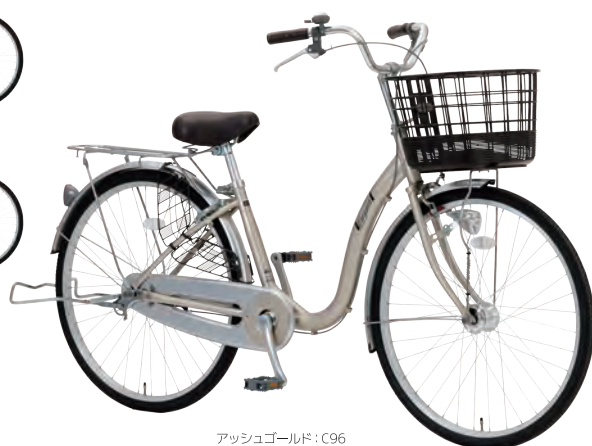
アッシュゴールド: C96