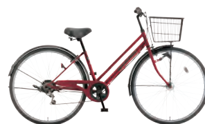
カーディナルレッド: R81