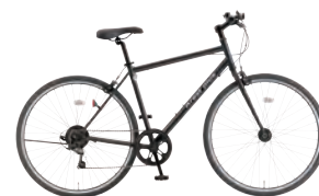
フラットブラック: K02