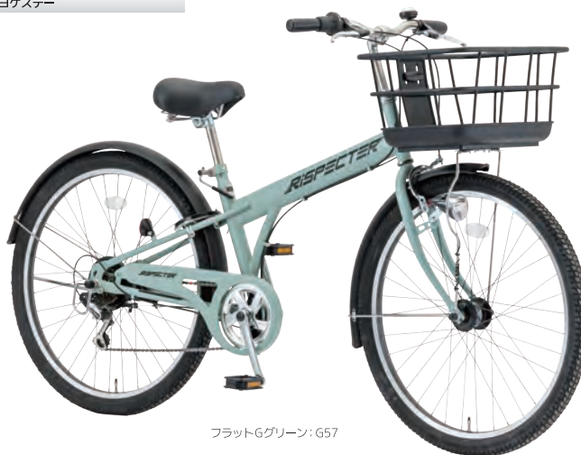
フラットGグリーン:G57