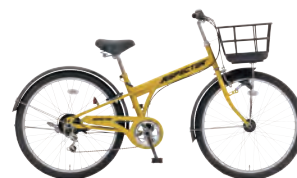
フラットマスタード:Y22